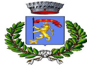
Comune di SAN GIOVANNI GEMINI