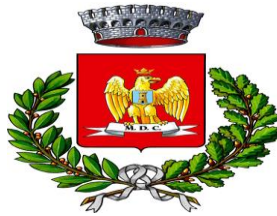
Comune di CASTELTERMINI